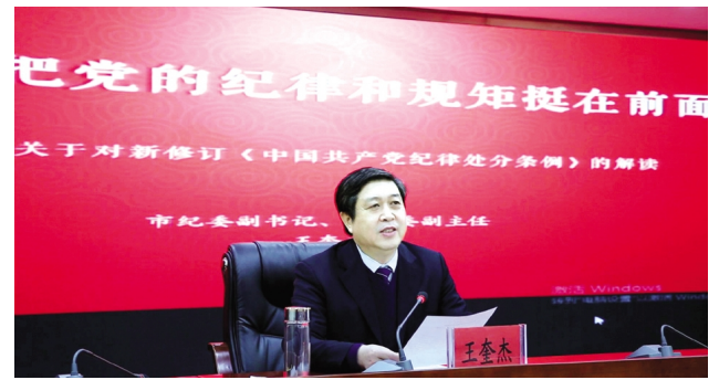
1 月 17 日上午,集团公司举办学习贯彻新修订的《中国共产党纪律处分条例》专题辅导报告会。邀请市纪委副书记、市监委副主任王奎杰对新《条例》进行辅导解读,集团公司党委书记、董事长杨龙主持并讲话。(工 纪)