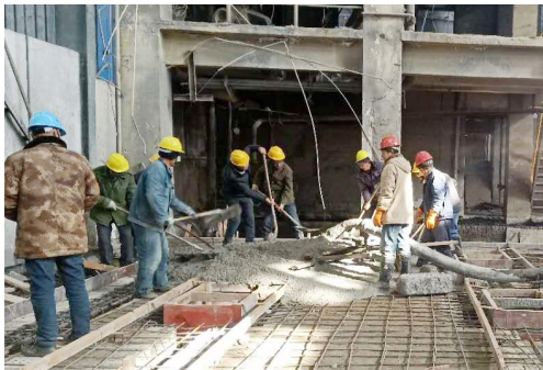
近日,房地产上元建材公司ALC板线升级改造项目工程正在如火如荼紧张施工中,为下一步竣工投产奠定了基础。(房宣)

该公司将继续狠抓细节,夯实基础,通过每一个安全生产管理细节的检查,及时发现存在的安全问题,将安全隐患消除在萌芽状态,也进一步提升了员工的安全意识和责任意识。确保公司春节期间安全生产、安全运营。(卢正杰)