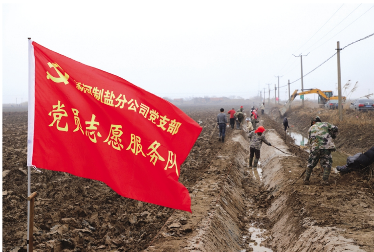
1月11日,日晒制盐公司组织广大员工开展冬准做坨大比武活动。通过本次比武,挖掘员工中的绝技、绝活,激发广大员工学技术、比技能、创一流的积极性,不断促进技能水平,进一步鼓舞员工大干冬准工作士气。(张明建)